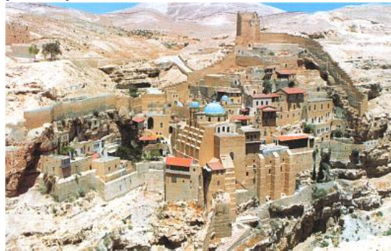
MONASTERIO DE SAN SABAS, EN PALESTINA.

Tropario de San Juan Damasceno - Tono VIII Campeón de la ortodoxia, maestro de la pureza y de la verdadera adoración, iluminador del universo y el adorno de los jercas: Todo sabio Padre Juan, tus enseñanzas han llenado de luz todas las cosas. Intercede ante Cristo nuestro Dios, para que salve nuestras almas.