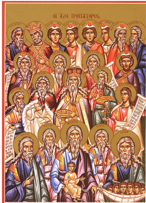
DOMINGO ANTERIOR A LA NAVIDAD

Divina Liturgia por la Navidad Mañana Lunes 24 a las 20:30 Hrs