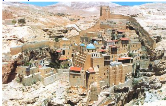
MONASTERIO DE SAN SABAS, EN PALESTINA.

Tropario de San Juan Damasceno - Tono VIII Campeón de la ortodoxia, maestro de la pureza y de la verdadera adoración, iluminador del universo y el adorno de los jerarcas: Todo sabio Padre Juan, tus enseñanzas han llenado de luz todas las cosas. Intercede ante Cristo nuestro Dios, para que salve nuestras almas.